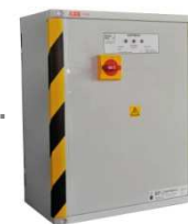
Armoire d'alimentation et de secours