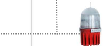
Balise basse Intensité type B rouge fixe de nuit

Armoire d'alimentation et de secours entrée 230/400V et/ou autonomie supérieure à 72h