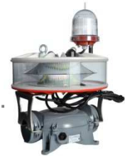
Feu Moyenne Intensité combiné type A et B, flash blanc de jour et rouge de nuit