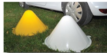
Balise tronconique :