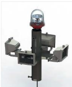
Iluminación externa de manga + baliza de obstaculo