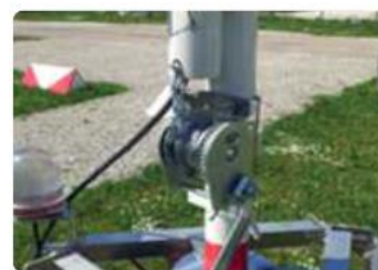
Cabestrante en opción