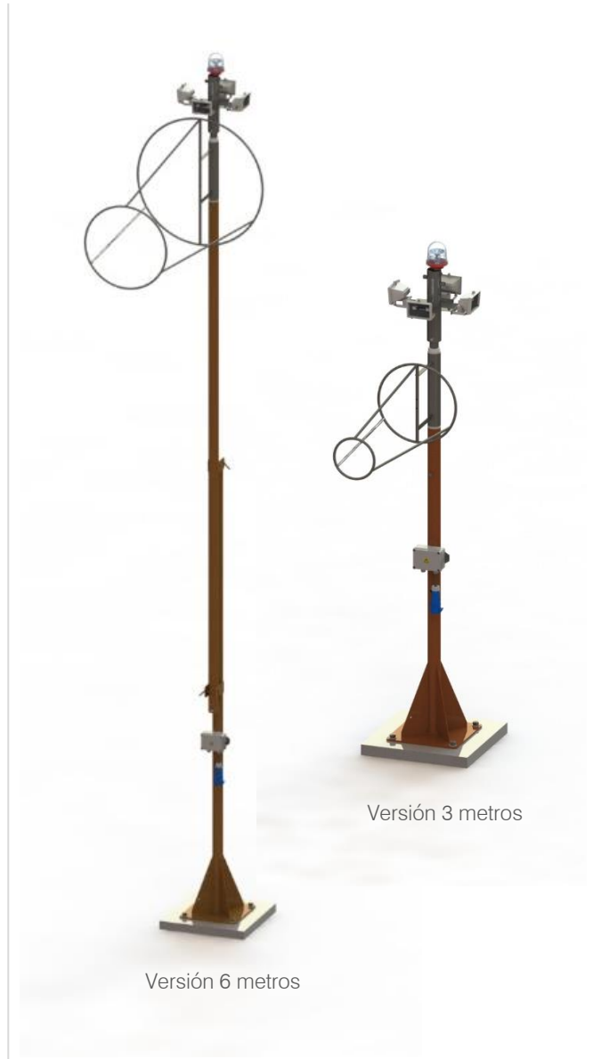
Versión 6 metros