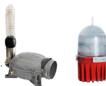
Balise d'obstacle basse Intensité type B rouge fixe de nuit