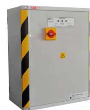
Armoire d'alimentation et de secours